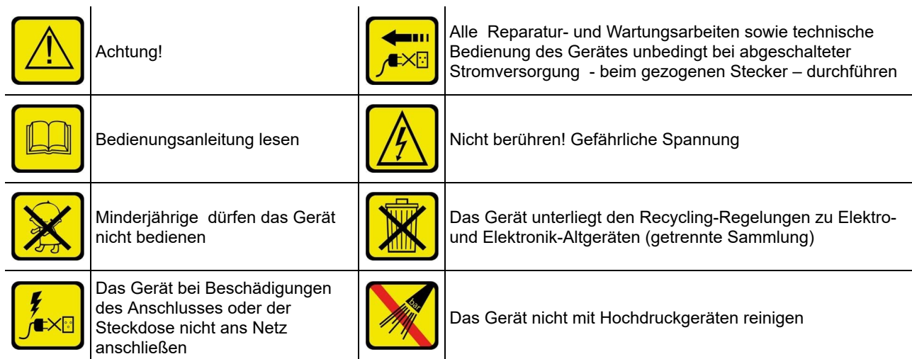
Tab. 2 Bedeutung der Piktogramme auf dem Gerät