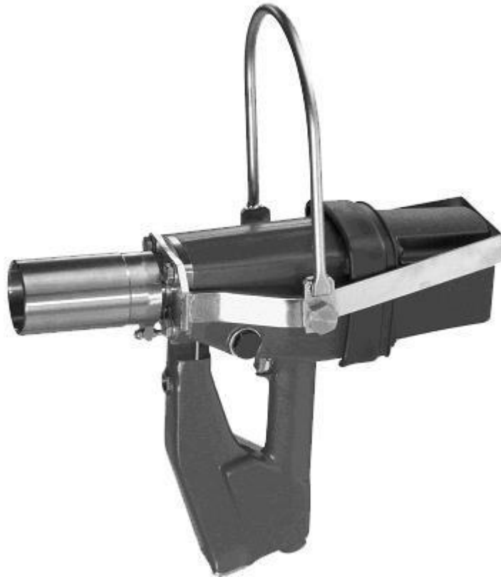
Dispositivo de anestesia de animais VB 225

Schmid und Wezel GmbH Maschinenfabrik Maybachstraße 2 D-75433 Maulbronn Tel. +49-(0)7043-102-0 Fax +49-(0)7043-102-78 E-mail: efa-verkauf@efa-germany.de www.efa-germany.com